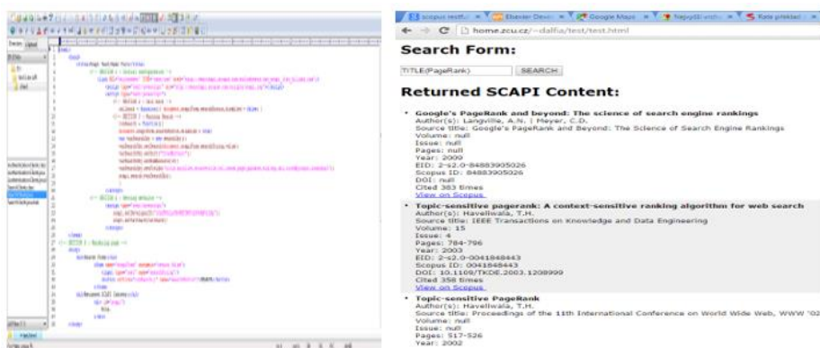
Obr. 3. Automatický import záznamů z databáze Scopus ( SCAPI )

Kromě této odlehčené verze je rovněž k dispozici API Web Services Expanded poskytující i mnoho dalších údajů o článcích jako jsou např. počty citací, adresy autorů nebo abstrakty [12]. Všechny rozhraní lze užívat jen po registraci a získání přístupového klíče. Podobně na obr. 3 je ukázka programového kódu, který přes Scopus API [13], kdysi označované jako SCAPI , zobrazuje importované záznamy ve webové aplikaci, jež je na rozdíl od WoS API povinným cílovým místem využití stahovaných dat: